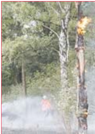
Heulen und Tosen: Durch Thermik entstehen gefährliche Winde.

Der allerdings wohl spektakulärste Einsatz der Feuerwehren im Landkreis Gifhorn war die große Waldbrand-Katastrophe 1975. Den Auftakt machte ein riesiger Waldbrand bei Stüde.